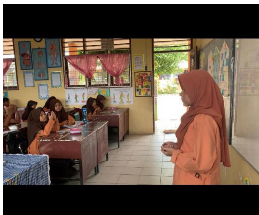
Gambar 5. Berdoa dalam bahasa Inggris yang dibawakan oleh siswa.