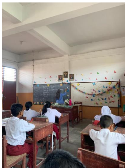
Gambar 4. Materi yang diajarkan oleh Ms. Ikke Seventiana.

Pada kegiatan observasi hari ke-3, Ikke menugasi siswa untuk mencari kosakata yang terdapat pada teks deskripsi yang sudah dikerjakan oleh siswa dan langsung menerjemahkannya kedalam Bahasa Inggris menggunakan kamus. Ketika ada siswa yang mendapatkan jawaban, maka mereka akan mengacungkan tangan dan menuliskannya ke papan tulis. Dengan metode ini maka semangat para siswa dalam belajar akan semakin meningkat. Setelah pembelajaran di kelas selesai, kelas ditutup dengan berdoa.