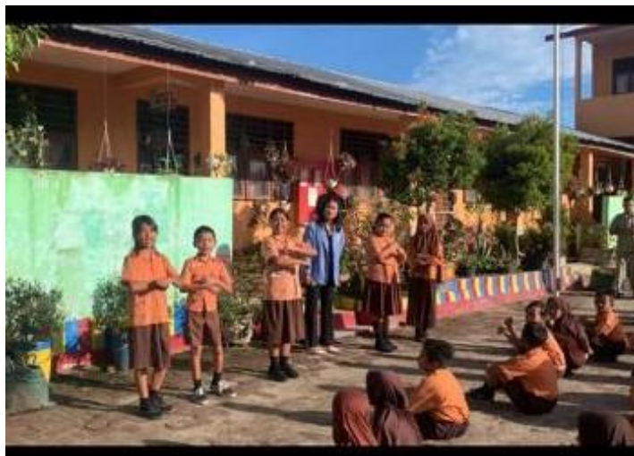
Gambar 10. Siswa yang mempraktekkan di lapangan mengenai lagu Bahasa Inggris yang sudah dipelajari disertai dengan gerakannya.

Tim observasi memberikan apresiasi terhadap antusias siswa dalam mengerjakan tugas mereka dengan memberi A+(Tepuk Tangan) yang bertujuan untuk menambah semangat mereka dalam mengerjakan tugas.