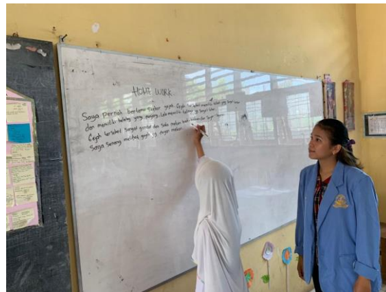
Gambar 9. Siswa yang sudah mampu dalam pembelajaran descriptive text.