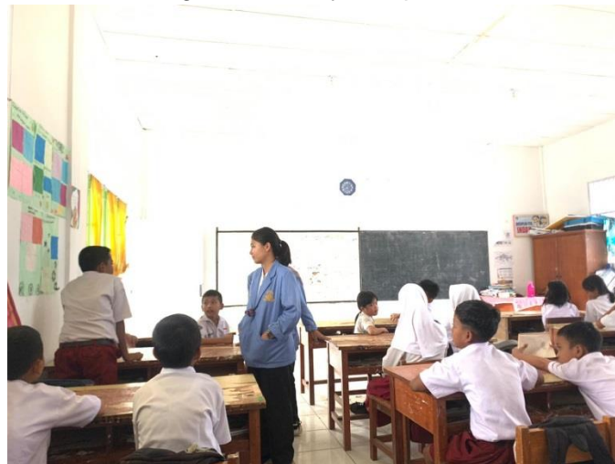
Gambar 1. Perkenalan Diri Oleh Siswa.

Thank you lord for all your blessing so we can complete the lesson well today. We pray to You that the lesson will be useful to us and people around us. We will return to our home now. Please give us safety and protection. Amen.