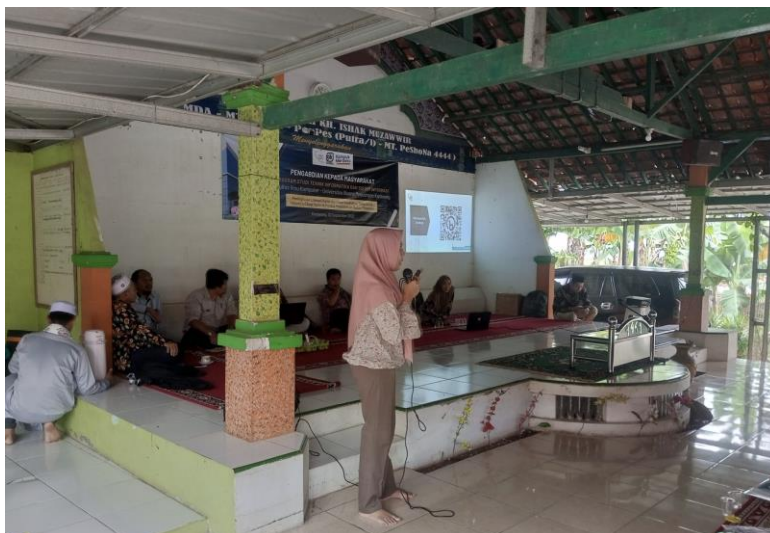
Gambar 2. Pemaparan Pengenalan VSDC

Melalui sesi praktik menggunakan aplikasi VSDC, peserta memiliki kesempatan untuk menerapkan pengetahuan yang telah mereka pelajari. Mereka dengan antusias mencoba berbagai fitur dan alat pengeditan yang disediakan oleh aplikasi. Para peserta menunjukkan keterampilan dan kemampuan yang menakjubkan dalam mengedit video dengan menggunakan aplikasi VSDC. Proses pengenalan ditunjukkan pada Gambar 2.