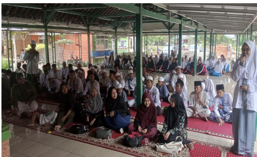
Gambar 3. Diskusi dan Tanya Jawab

Selain itu, kegiatan ini juga memberikan manfaat yang signifikan bagi para peserta. Dalam proses pengeditan video, mereka belajar untuk mengembangkan kreativitas mereka dalam merancang konten yang menarik. Peserta merasa senang dan puas melihat hasil akhir dari video yang mereka edit, karena mereka berhasil menciptakan materi pembelajaran yang menarik dan bermanfaat. Dokumentasi diskusi dan tanya jawab terkait pengenalan VSDC ditunjukkan pada Gambar 3.