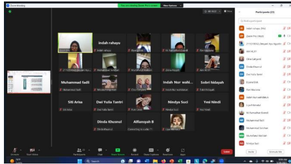
Gambar 2. Pemateri 1 tentang Manajemen Sekolah

13.30 secara diskusi langsung. Berikut pemateri 1 dalam memberikan materi seperti tampak pada gambar 2 di bawah ini.