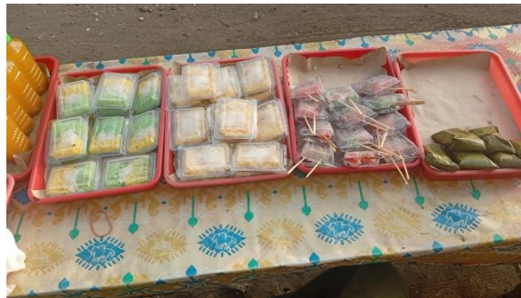
Gambar 5. Penyaluran Bantuan Zakat untuk mustahik pejual gorengan

Gambar diatas menunjukkan proses penyaluran bantuan zakat produktif kepada mustahik yang dilakukan secara langsung. Penyaluran ini tidak hanya berupa pemberian modal usaha, tetapi juga disertai dengan arahan terkait pemanfaatan bantuan agar sesuai dengan kebutuhan usaha masing-masing. Dokumentasi ini menggambarkan bahwa program dilaksanakan secara transparan dan melibatkan interaksi langsung antara pelaksana program dan penerima manfaat (Mahmudah & Yasin, 2022).