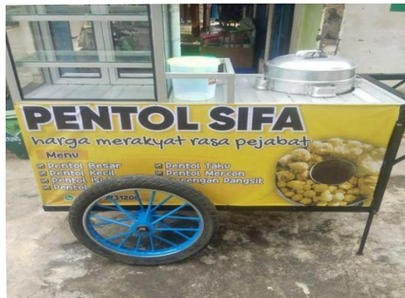
Gambar 2. Penyaluran Bantuan Zakat mustahik warung kelontong

Bantuan yang diberikan tidak bersifat seragam, melainkan disesuaikan dengan kondisi usaha masing-masing mustahik. Sebagai contoh, pada usaha rujak buah dan gorengan diberikan tambahan modal untuk meningkatkan kapasitas produksi dan variasi produk, sedangkan pada usaha pentol keliling diberikan dukungan untuk perbaikan sarana usaha seperti gerobak. Sementara itu, pada usaha laundry difokuskan pada penambahan atau perbaikan alat untuk meningkatkan kualitas layanan. Pendekatan ini menunjukkan bahwa implementasi zakat produktif dilakukan secara berbasis kebutuhan, sehingga diharapkan mampu meningkatkan efektivitas penggunaan bantuan.