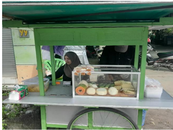
Gambar 4. Penyaluran Bantuan Zakat untuk mustahik pejual rujak