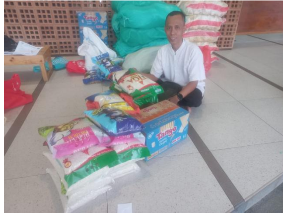
Gambar 3. Penyaluran Bantuan Zakat mustahik pejual pentol