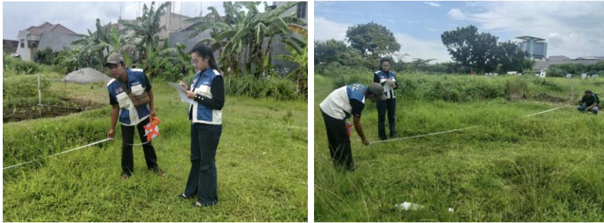
Gambar 2. Observasi dan analisis situasi pembangunan greenhouse

Pelaksanaan program pendampingan teknis pembangunan greenhouse di Desa Balongsari menghasilkan capaian yang terukur pada aspek kapasitas mitra, kesiapan dokumen teknis, serta pembangunan fisik sarana produksi pangan. Kegiatan diikuti oleh Kelompok Swadaya Masyarakat (KSM) Bina Makmur dan KSM Tani Balongsari sebanyak 45 orang.