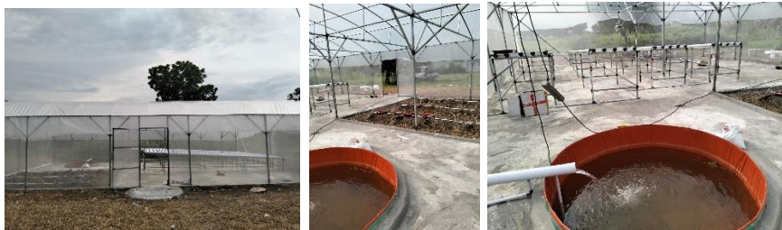
Gambar 5. Konstruksi bangunan greenhouse

RAB kemudian dihitung dengan menggunakan hasil desain gambar kerja sebagai panduan. Dalam hal ini, HSPK Kota Mojokerto tahun 2025 digunakan untuk melakukan analisis harga satuan pekerjaan. Hasil dari tindakan ini adalah dokumen rencana anggaran sebesar Rp 138.234.676, yang mencakup informasi tentang Rp 8.000.000 untuk pekerjaan persiapan, Rp 79.116.000 untuk pembelian material, dan Rp 51.118.676 untuk biaya tenaga kerja. Berdasar paa RAB tersebut, proses selanjutnya yaitu pendampingan kegiatan pembangunan greenhouse , seperti gambar 5.