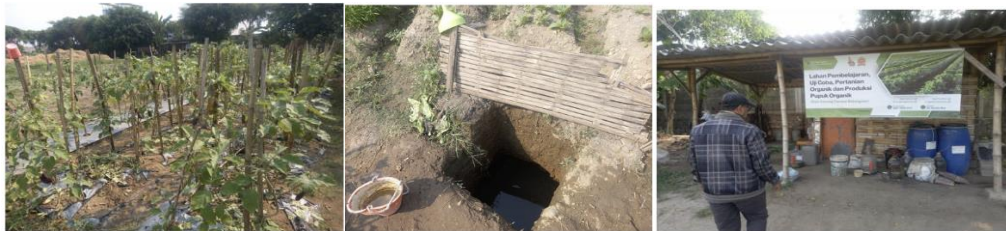
Gambar 1. Analisis situasi belum maksimalnya pemanfaatan ruang terbuka

Kondisi lapangan menunjukkan bahwa sebagian besar rumah tangga belum memanfaatkan ruang terbuka untuk produksi pangan mandiri (Wolfert et al., 2017). Hasil focus group discussion (FGD) bersama masyarakat dan pemerintah desa menunjukkan bahwa sekitar 85% rumah tangga belum mengoptimalkan lahan pekarangan maupun aset desa untuk budidaya tanaman pangan. Di sisi lain, konsumsi sayuran segar masyarakat masih berada di bawah rekomendasi kesehatan, sementara inflasi pangan daerah turut menekan daya beli masyarakat (Perwali Kota Mojokerto Nomor 3 Tahun 2024, 2024). Situasi tersebut memperlihatkan bahwa persoalan ketahanan pangan lokal tidak hanya terkait ketersediaan pangan, tetapi juga kapasitas teknis masyarakat dalam memproduksi pangan secara mandiri.