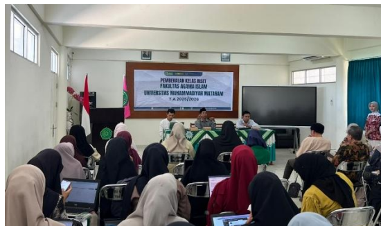
Gambar 1. Suasana Kegiatan Pelatihan Publikasi Ilmiah

Pada sesi terakhir, dilaksanakan simulasi proses unggah artikel ke jurnal ilmiah, di mana peserta mempraktikkan langkah-langkah submit ke portal jurnal, mulai dari pembuatan akun hingga pengunggahan naskah lengkap. Kegiatan pelatihan ini terdokumentasi dalam gambar berikut, yang menunjukkan suasana pelaksanaan workshop kelas riset Fakultas Agama Islam Universitas Muhammadiyah Mataram Tahun Akademik 2025/2026. Terlihat antusiasme peserta yang tinggi dalam mengikuti setiap sesi, dengan sebagian besar mahasiswa aktif menggunakan laptop untuk mengikuti praktik penulisan artikel secara langsung.