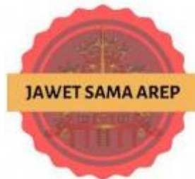
Gambar 2. Logo UMKM Jawet Sama Arep

Gambar tersebut merupakan logo UMKM Jawet Sama Arep yang berfilosofi kehidupan masyarakat dayak, dan tulisan Jawet Samas Arep memiliki makna yaitu bekerja sama. Melalui logo tersebut menjadi identitas UMKM Jawet Sama Arep sehingga mudah dikenal masyarakat luas.