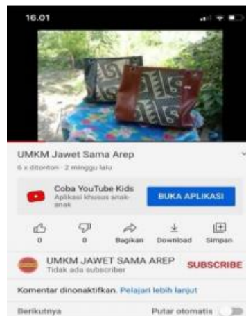
Gambar 7. Tampilan Profil Youtube UMKM Jawet Sama Arep

Youtube merupakan saluran sosial media yang memungkinkan orang diseluruh dunia untuk berinteraksi, berbagi, dan membuat konten melalui komunitas online.