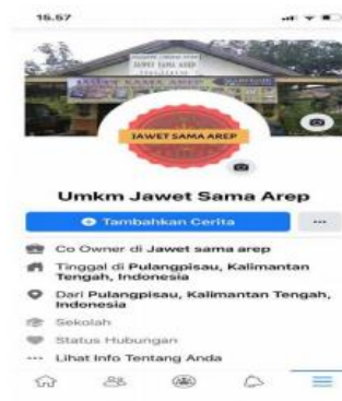
Gambar 4 Tampilan Profil Facebook UMKM Jawet Sama Arep

Gambar di bawah memperlihatkan tampilan profil facebook dimanfaatkan sebagai media pemasaran dan promosi online guna mengembangkan brand image dari UMKM Jawet Sama Arep, melalui fanpage khusus sehingga usaha bisa berkembang dengan pesat, efektif dan efisien.