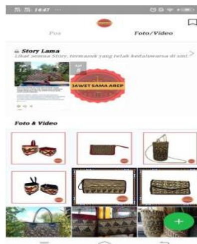
Gambar 9. Tampilan Profil Line UMKM Jawet Sama Arep

Line merupakan sebuah aplikasi instant messaging asal Jepang, yang dapat digunakan untuk mengirim pesan, gambar, foto, video, suara, share location dan membuat album foto untuk berbagi momen bersama teman dan keluarga. Fitur-fitur yang terdapat dalam line mendukung pengguna dalam mengembangkan brand image dan promosi dari UMKM Jawet Sama Arep. Line yang dimanfaatkan UMKM Jawet Sama Arep sebagai sarana komunikasi antara penjual dan pembeli. Dengan menggunakan line pelaku usaha dapat berinteraksi secara langsung dengan pembeli serta dapat mengirimkan boardcast message terkait produk yang sedang mereka pasarkan. Adanya boardcast ini sangat membantu pelaku usaha menawarkan produknya kepada para konsumen untuk informasi produk terbaru.