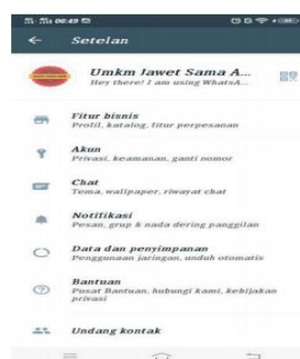
Gambar 10. Tampilan Profil Whatsapp UMKM Jawet Sama Arep

Whatsapp merupakan aplikasi yang di desain secara khusus untuk memudahkan para pemilik usaha dalam menjalankan usahanya, salah satu manfaat whatsapp untuk pemasaran bisnis online ialah sebagai sarana komunikasi dengan para pelanggan. Dalam dunia bisnis komunikasi merupakan hal yang sangat penting agar terjadinya interaksi antara penjual dan pembeli.