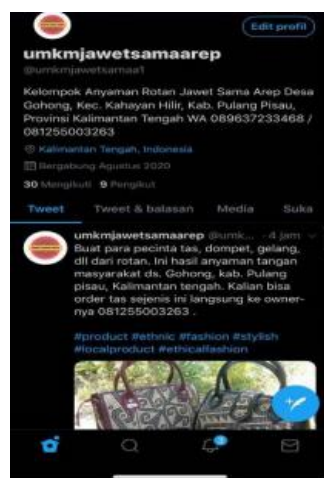
Gambar 6 . Tampilan Profil Twitter UMKM Jawet Sama Arep

Media promosi selanjutnya adalah twitter, media ini memiliki daya tarik yang cukup populer tentunya di kalangan milenial. Media sosial twitter digunakan untuk mempromosikan hasil produk dari UMKM Jawet Sama Arep, serta sebagai kegiatan pemasaran yang membangun ingatan dan tindakan terhadap merk atau produk seperti terlihat pada gambar 6 yang memperlihatkan tampilan profil UMKM Jawet sama Arep dalam bentuk twitter.