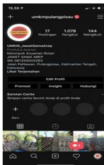
Gambar 5. Profil instagram UMKM Jawet Sama Arep

Promosi melalui media sosial instagram dinilai menjadi salah satu media sosial yang lebih unggul dari lainnya, yang dimana banyak dimanfaatkan para pelaku usaha maupun perusahaan untuk membantu mempromosikan produk dan jasanya.